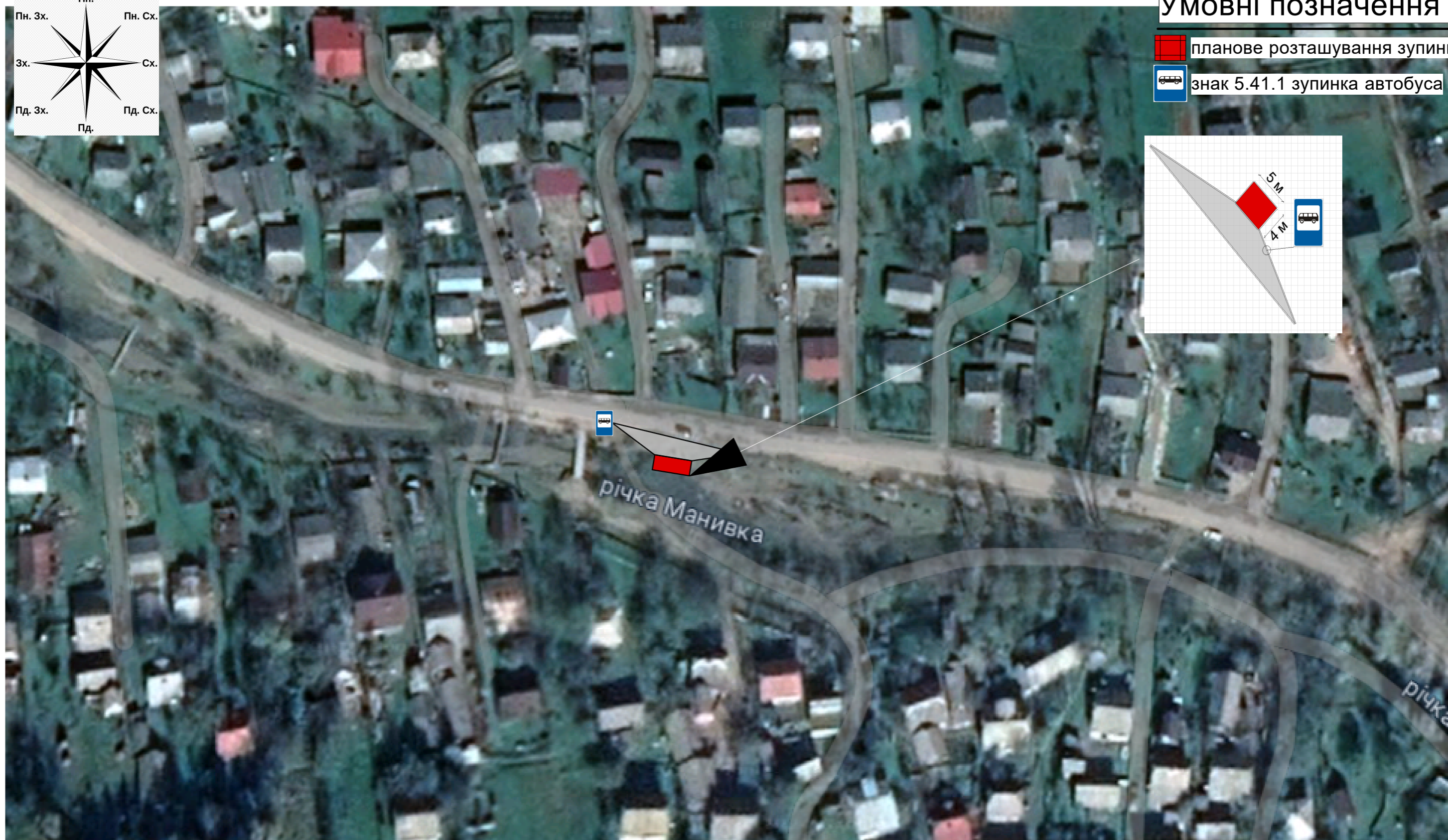
Схема місця облаштування автобусної зупинки