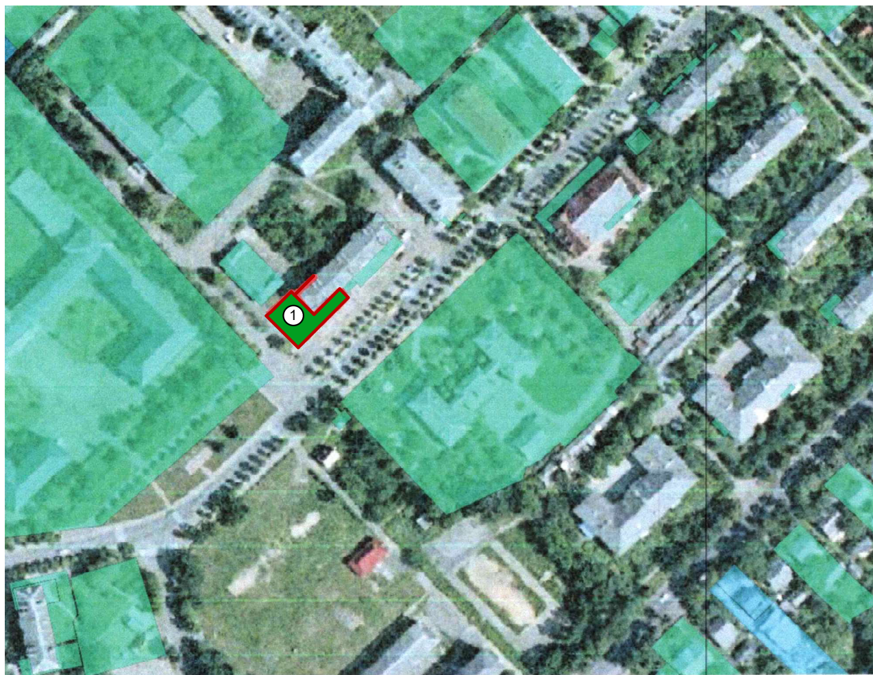
Схема розташування території в системі планувальної структури населеного пункту М 1:5000