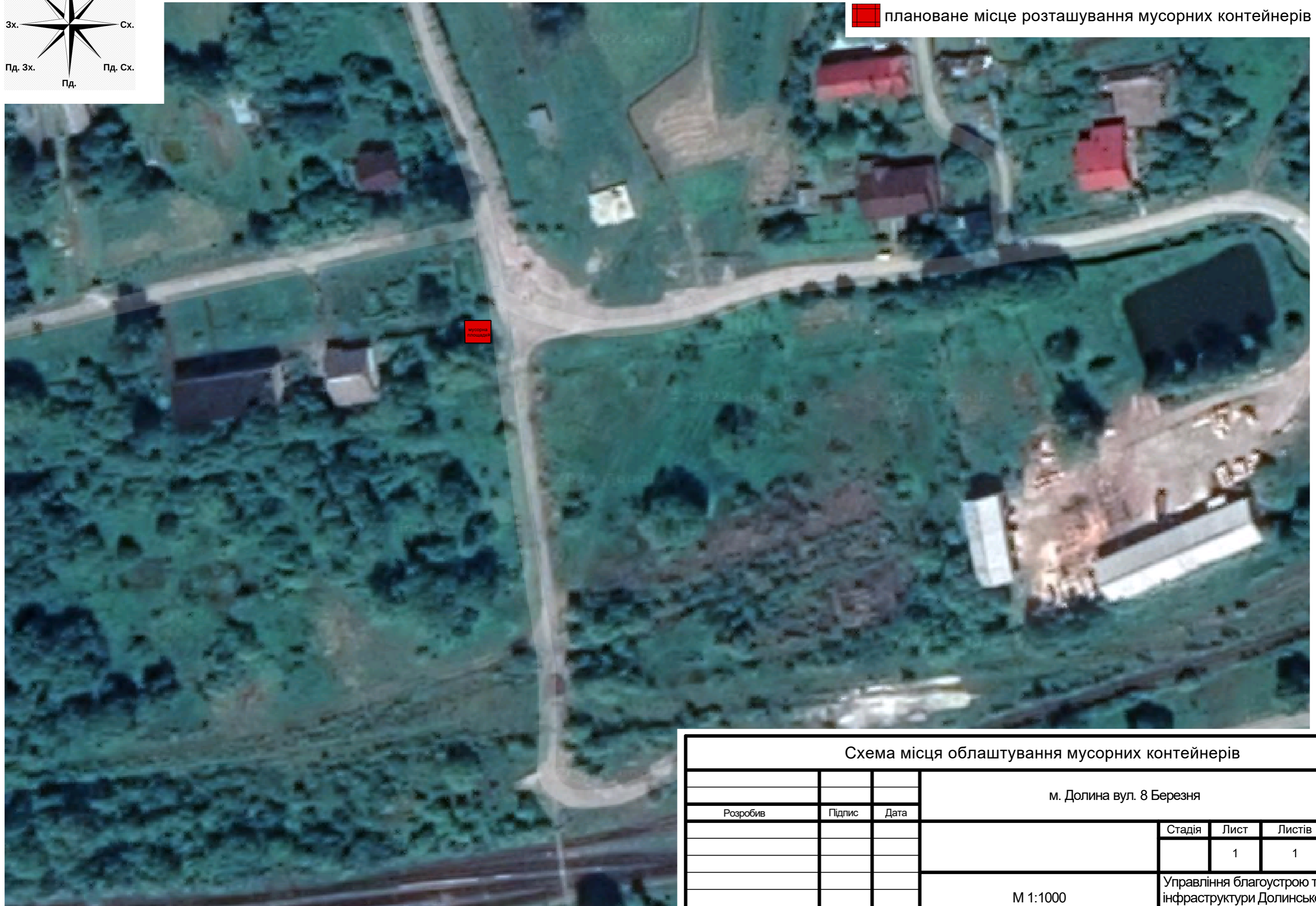
Схема місця облаштування мусорних контейнерів