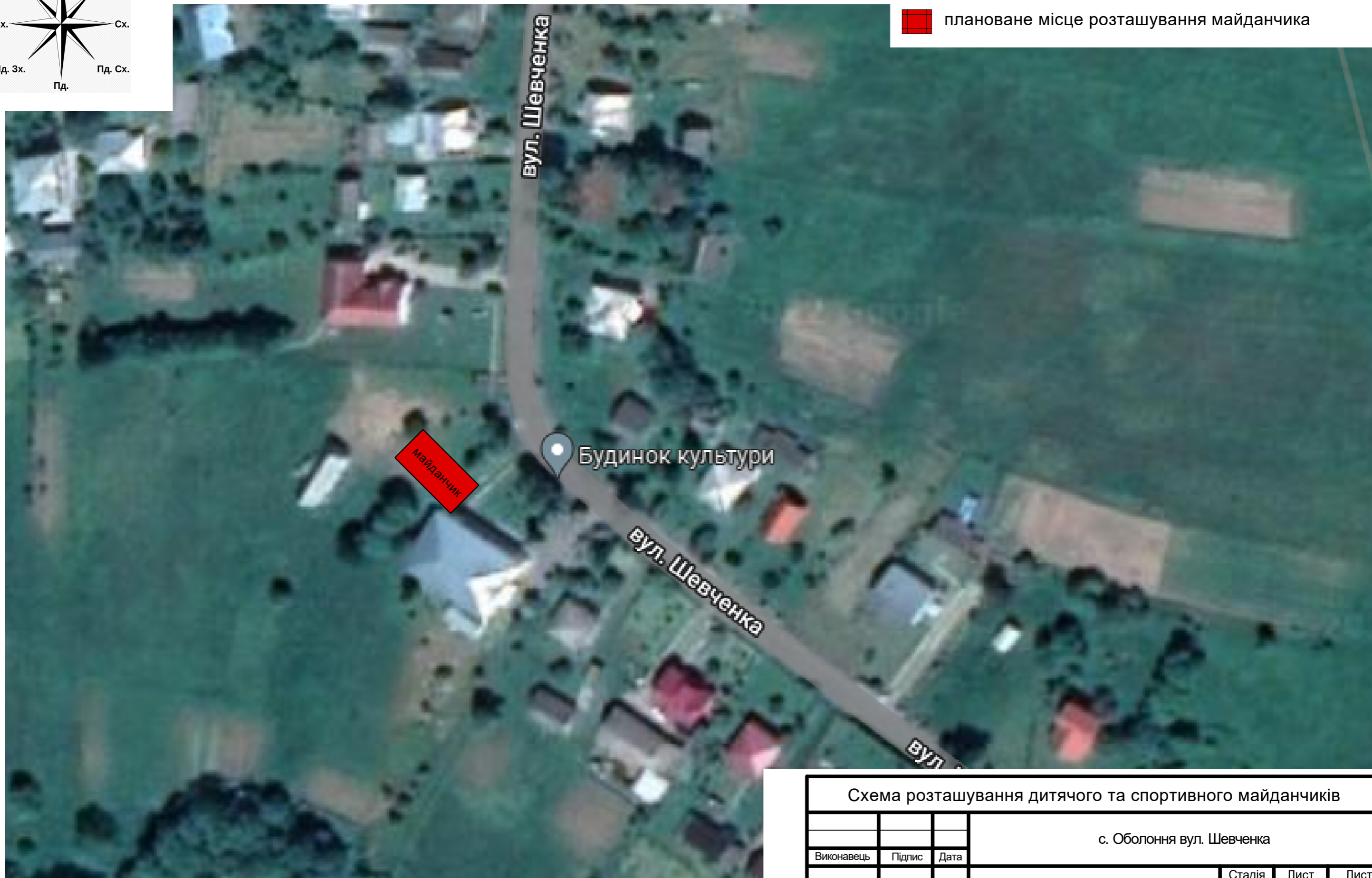
Схема розташування дитячого та спортивного майданчиків