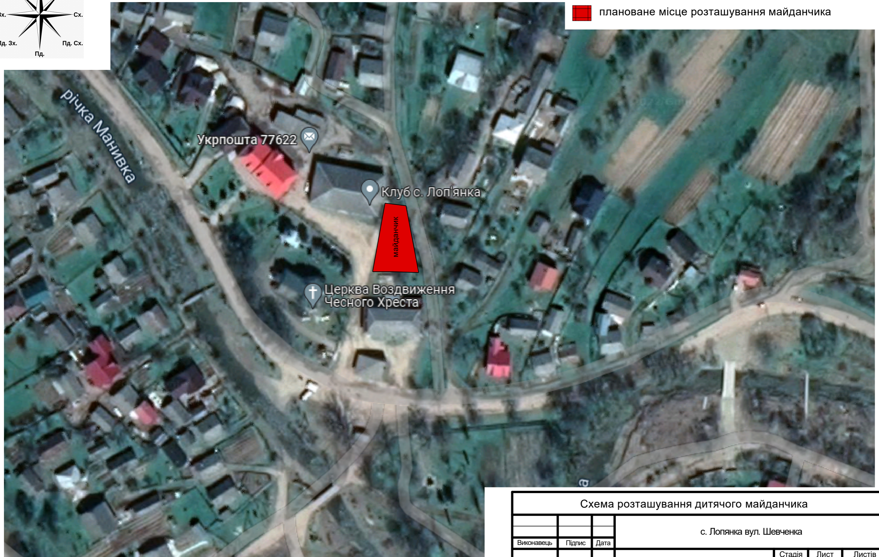
Схема розташування дитячого майданчика