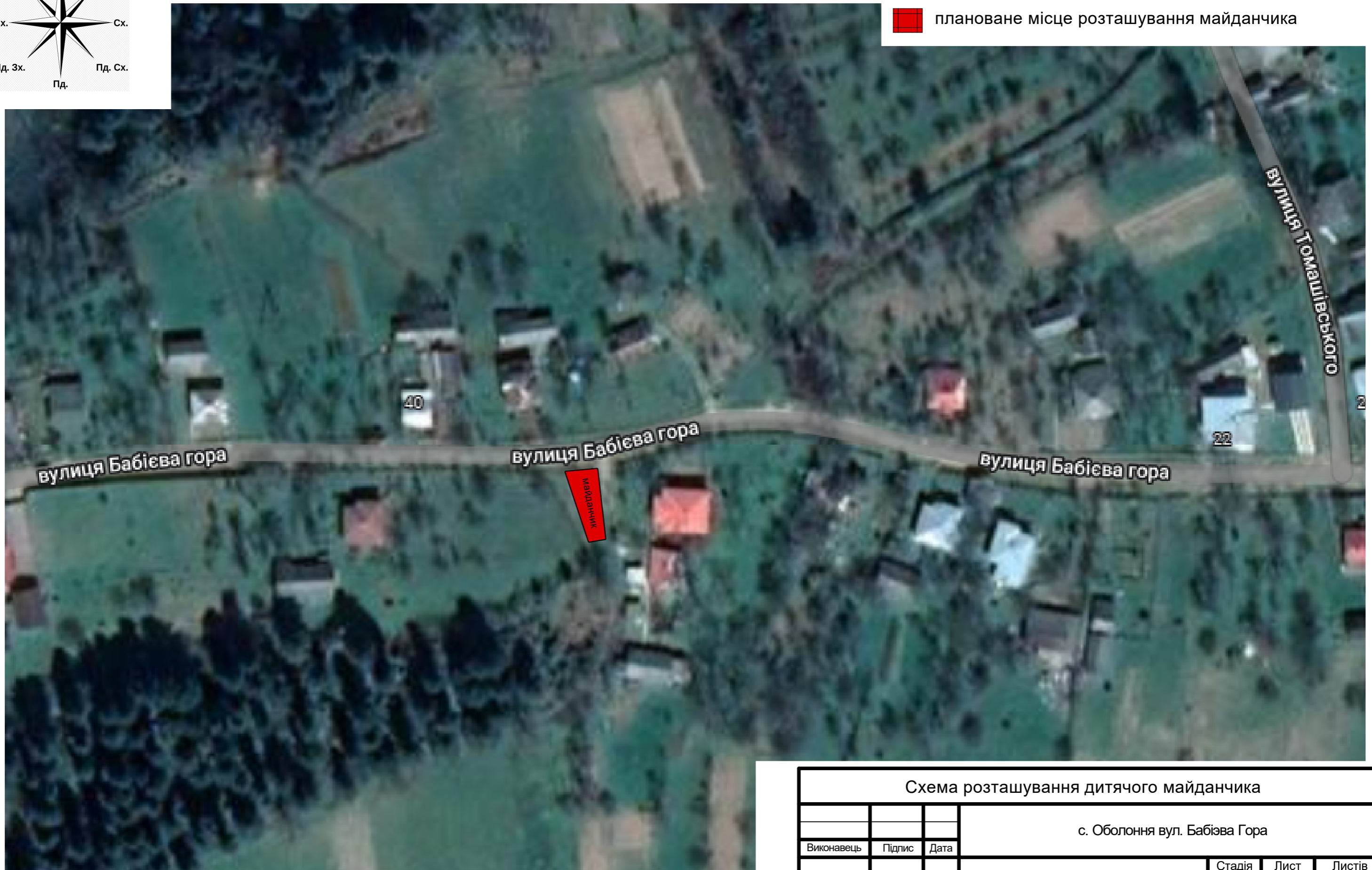
Схема розташування дитячого майданчика